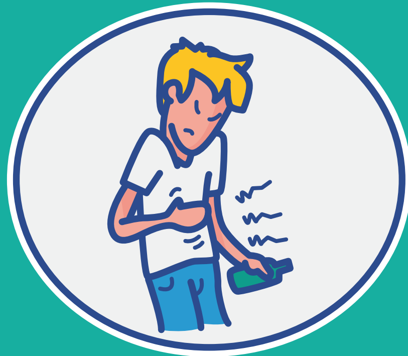
Sorge um die Gesundheit des Betroffenen

Wie Alkoholkonsum auch Angehörige belasten kann