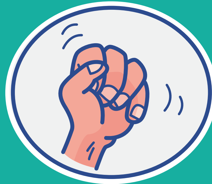
Angst vor Aggressionen von Seiten des Betroffenen