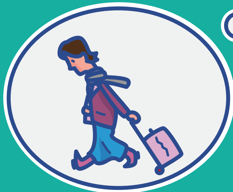
Angst vor der Zukunft und dem Auseinanderfallen der Familie